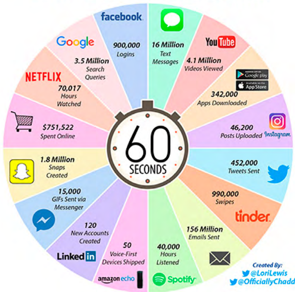
Figura 1: What happens in 60 seconds on Internet ( http://thebln.com/2017/03/happens-every-minute-internet-2017/ )